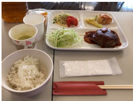
美味しい地産地消ランチ