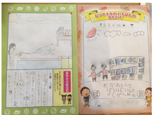
ツアー後子どもが書いた絵日記