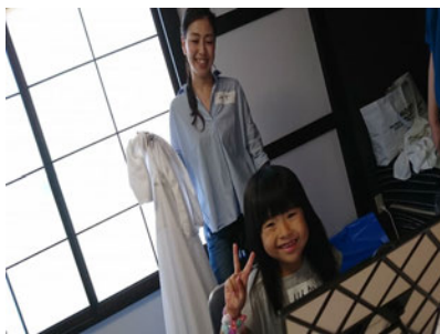
ヘアカットサ ビスですっきり