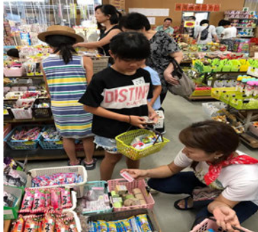
駄菓子の大町買い物 300円チケット進