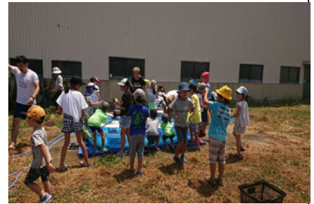
大人気の水遊び（大町にて）